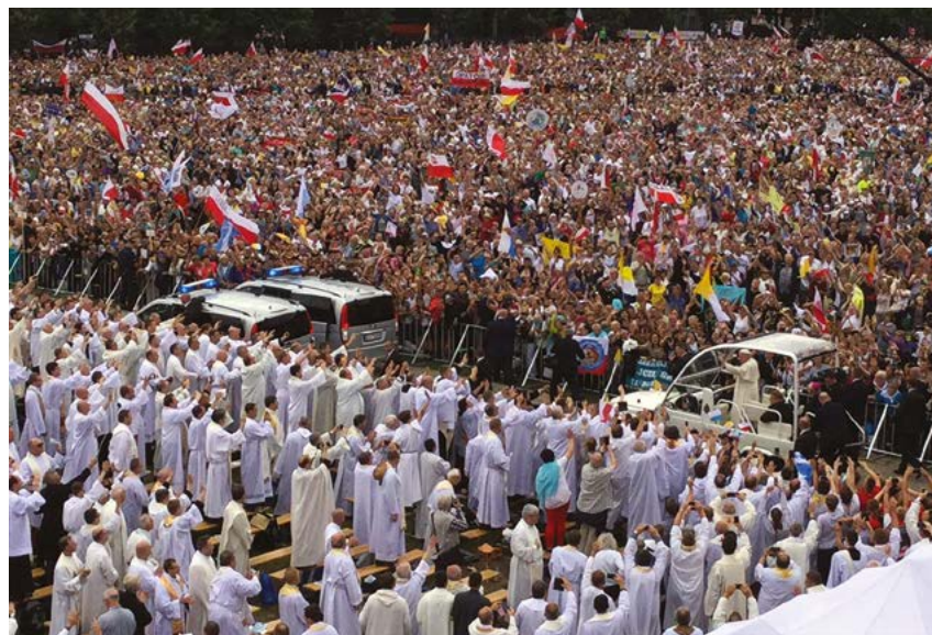
Według wyliczeń komitetu organizacyjnego w niedzielnej mszy świętej z udziałem papieża Franciszka w Brzegach udział wzięło ok. 3 mln pielgrzymów ze 187 krajów.