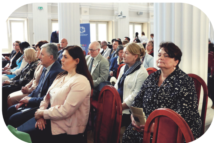
Zaproszeni goście, prelegenci oraz uczestnicy Konferencji