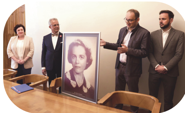
Przekazany przez KSW O. w Sędziszowie Młp. portret Patronki Nauczycieli zawieszony w sali konferencyjnej gmachu MEN i N w Warszawie.