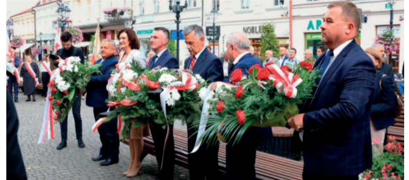
Na placu farnym przedstawiciele rządu, samorządu, instytucji kultury, jednostek współpracujących, organizacji zakładowych NSZZ „S” złożyli wieńce i kwiaty