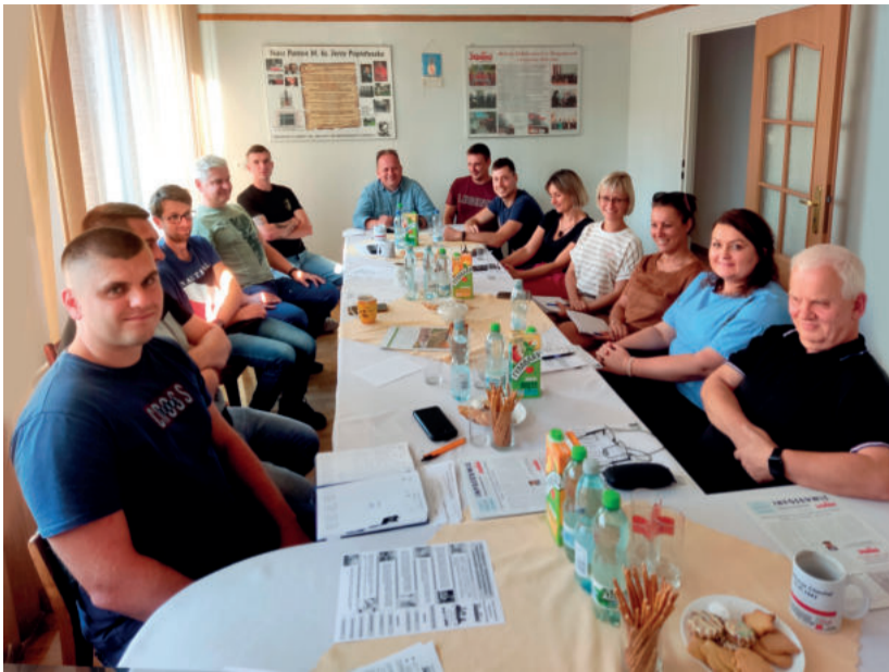
Przedstawiciele organizacji związkowych ropczycko-sędziszowskiej „Solidarności”

We wtorek 5 września w Ropczycach zainaugurowaliśmy serię spotkań z członkami „Solidarności” w Oddziałach ZR rzeszowskiego.