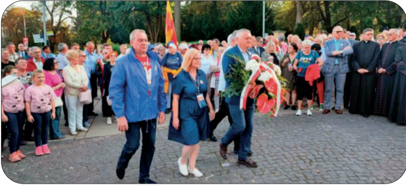
Pierwszym punktem pielgrzymki było złożenie kwiatów pod pomnikiem błogostawionego Jerzego Popiełuszki w Częstochowie

Tegoroczna Pielgrzymka Ludzi Pracy odbyła się pod hasłem „Matko, pomóż nam zło dobrem zwyciężać” i tradycyjnie już skupiła ludzi Solidarności z całej Polski.