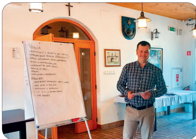
Wiśniowa, 5-6.10.2023 r. Szkolenie podstawowe dla działaczy