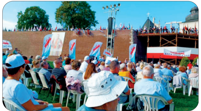
Niemal 400 pielgrzymów z Regionu Rzeszowskiego wzięło udział w PLP