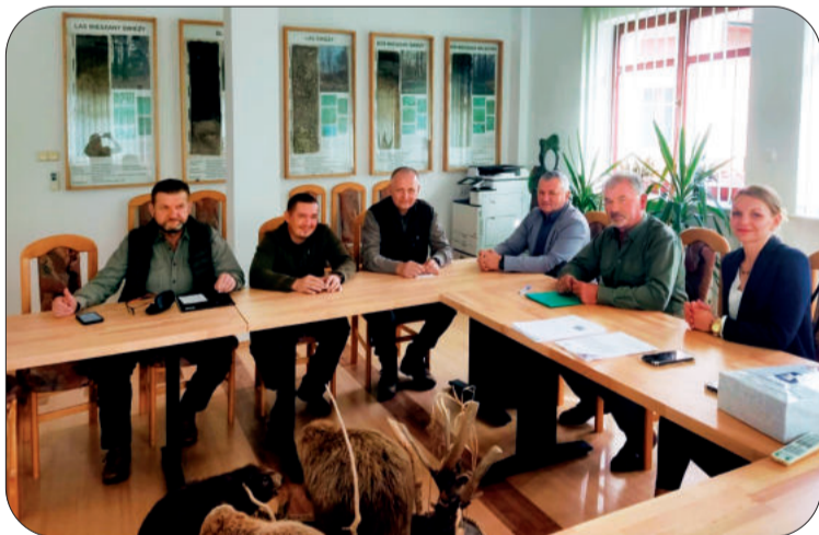
Spotkanie odbyło się w siedzibie leżajskiego Nadleśnictwa

Lasy Państwowe Nadleśnictwo Leżajsk to kolejne miejsce, w którym budowaliśmy świadomość pracowniczą na temat roli i przynależności do związku zawodowego Solidarność. W zakładzie pracy, w którym działa Solidarność, rzadziej łamane są prawa pracownicze, a Komisja Zakładowa prowadząc negocjacje z pracodawcą dba m.in. o zwiększanie wynagrodzenia.