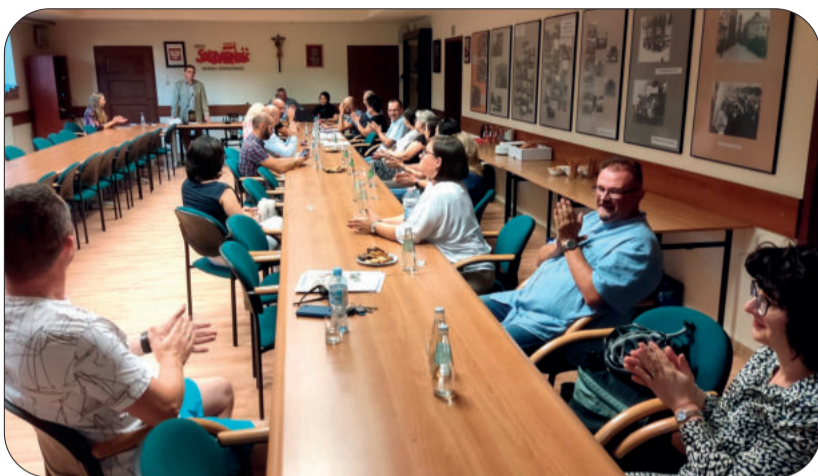
Spotkanie odbyło się w siedzibie ZR

Kluczem do sukcesu każdej organizacji jest jej liczebność, niezwykle ważna w negocjacjach z pracodawcą. Nie ustępuje jej jednak dobra komunikacja z członkami związku. Dlatego 21 września zorganizowano spotkanie Organizacji Zakładowej NSZZ „Solidarność” Pracowników Urzędu Miasta w Rzeszowie. Mimo cotygodniowych spotkań komisji i ustalaniu planu działania, ważne są również bezpośrednie rozmowy z członkami związku i wsłuchanie się w ich potrzeby.