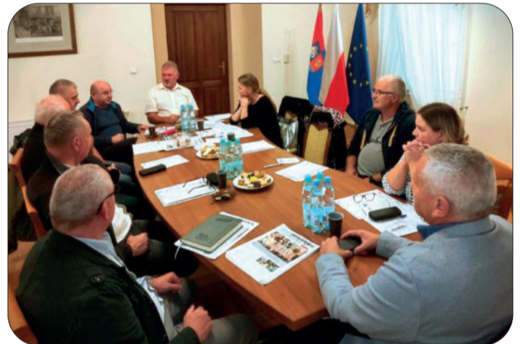
Spotkanie odbyło się w siedzibie Oddziału ZR w Leżajsku

Cykl spotkań z działem rozwoju cieszy się coraz większą popularnością, tym razem, 19 września, spotkaliśmy się z przedstawicielami organizacji związkowych w Leżajsku.