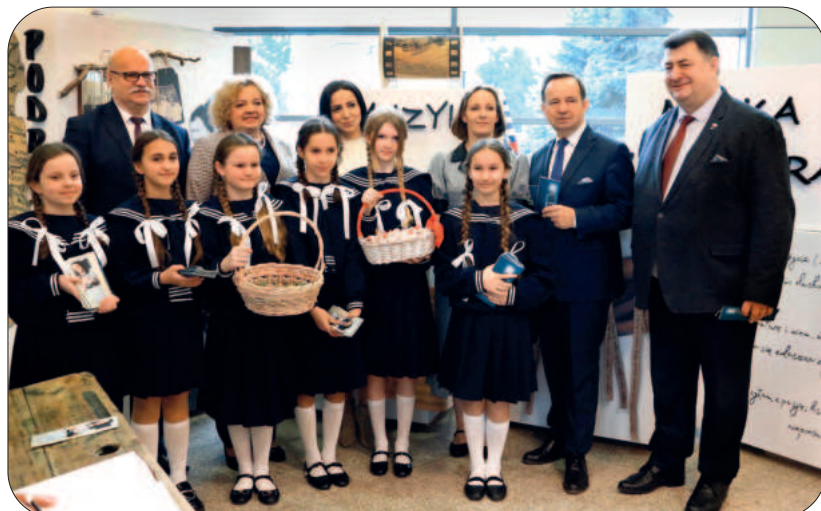
Uczennice Szkoły Podstawowej im. Sybiraków w Nawsiu w strojach z epoki